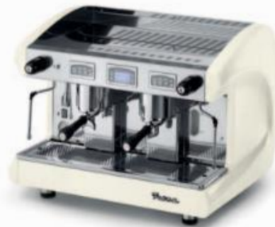
SAE2 DSP WHITE