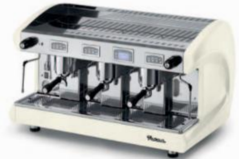
SAE3 DSP WHITE