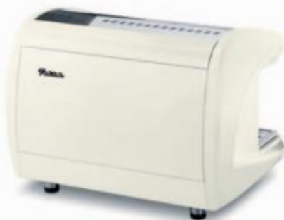
BACK2 FULL WHITE