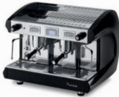
SAE2 DSP BLACK