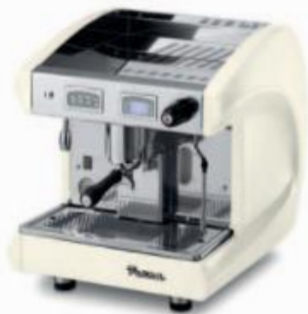
SAE1 DSP WHITE